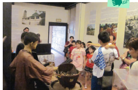
参观马六甲博物院