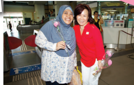
母亲节献花活动，不分宗族，齐乐融融