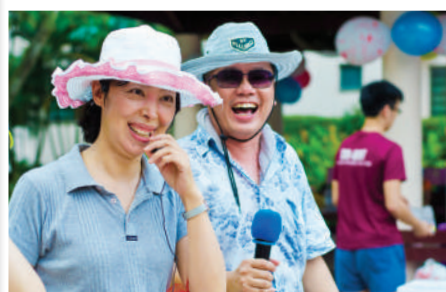
大家展开歌喉, 高唱生日歌