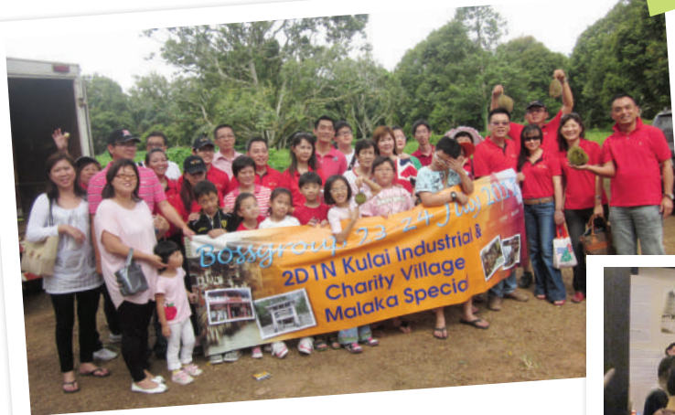
2011 参观马来西亚的榴莲园