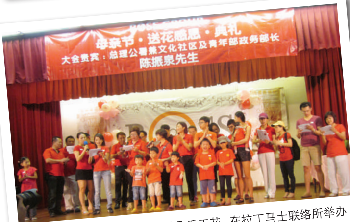
2014 这次增加至15000朵手工花，在拉丁马士联络所举办母亲节特备节目给居民们。