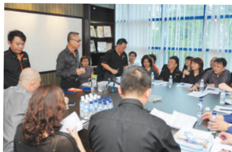
大家聚精会神，热烈地参与讨论