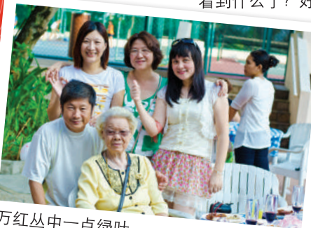
万红丛中一点绿叶...