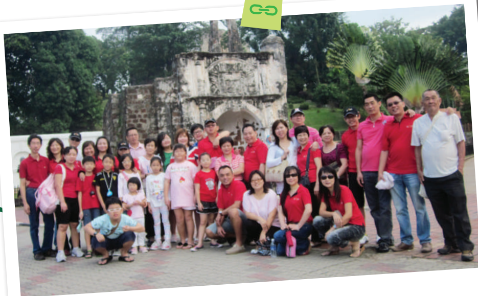
2011 团员到马六甲一日游