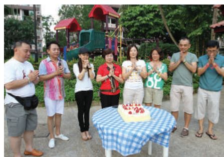
愿老板集团一年比一年茁壮, 源远流长。