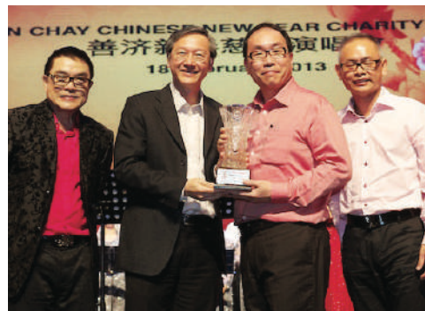
2013 善济新春慈善演唱会 善济董事与陈振泉部长合影

荣幸为“2013 善济新春慈善演唱会”的协办单位，老板集团动员80多位团员及朋友，出钱这慈善活动募款。每个团员都很热心参与和无私的奉献，大家的齐心协力为当晚的节目筹备与组织，也在众多赞助商及善心人士的支持下，也筹得善款。出席的人数有1,600位，演唱会以送票形式邀请热心人士及社区的乐龄人士前来观赏，响应空前的热烈，座无虚席。一切功成圆满。此活动让我们得BG团队更团结。