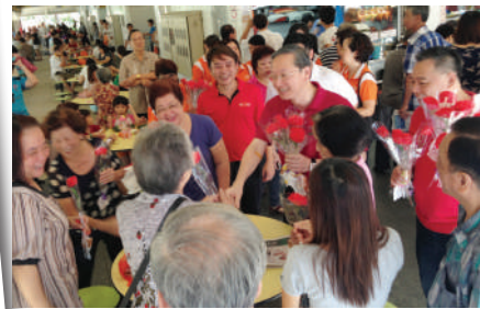
陈振泉部长也参与献花活动