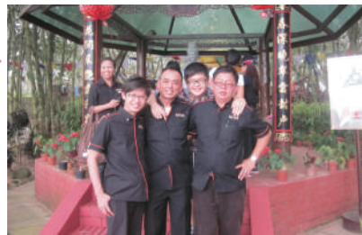
几位帅哥在观音亭前合照