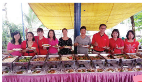
团员们准备为他人服务