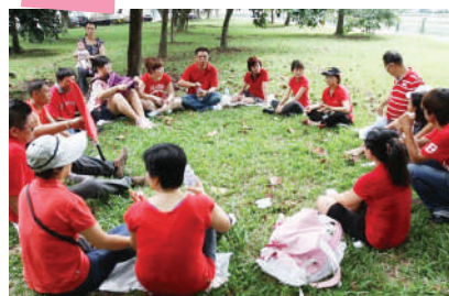
团员一起分享献花过程