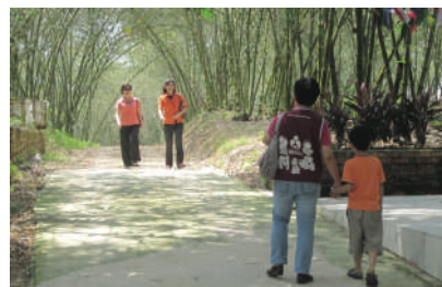
去慈善村时经过一片清幽恬静的竹林