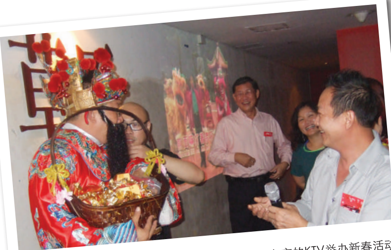
2012 在淡宾尼SAFRA草原之夜的KTV举办新春活动