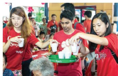
年轻的团员，加入为长辈服务的阵容