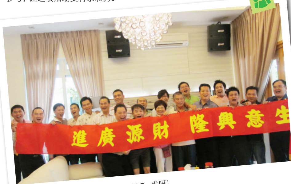
2010 新春佳节乐聚在依花妈妈家，发呀！

节目都经过精心策划，细腻安排，活动多元化，老少咸宜。大家载歌载舞，一同欢唱，仿佛就象孩童时期的欢乐园。团员们常常带了伙伴、朋友、伴侣及孩子一起来参与，让这项活动更有亲和力。