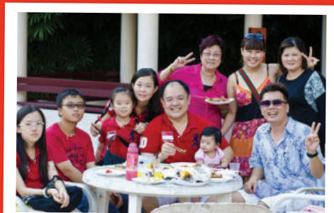
哟！连小婴儿也来凑热闹了