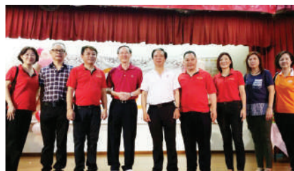
与拉丁马士联络所的团队合照。