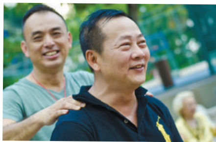
你忙碌了一天，换我服务你！