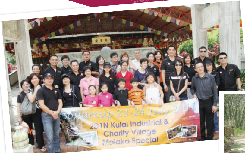
2011 到访座落在马来西亚古来的慈善村