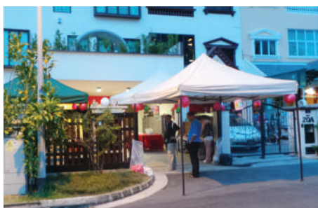
2013 在和丰大哥家庆祝中秋节。