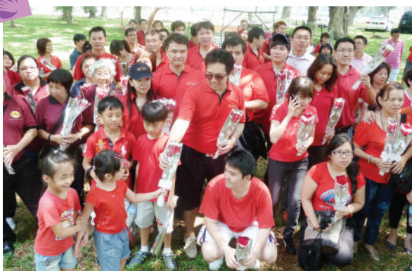
大家手拿鲜花，满腔热情的准备献花