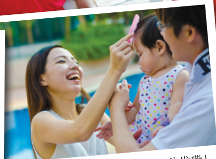
啊哟，妈妈没带发夹，要stye头发嘞！