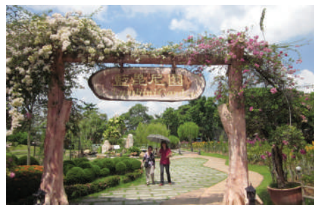
拜访吉隆坡佛光山, 风景如画