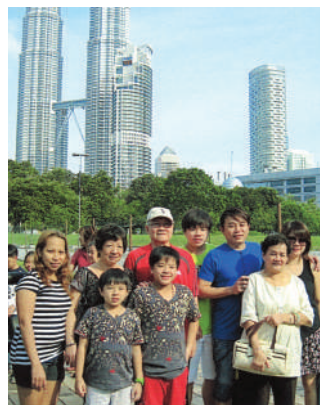
一家大小汇聚一堂