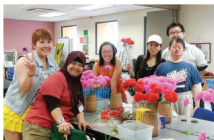
团员到MINDS领取手工花