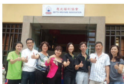
另一团员也在METTA领取手工花