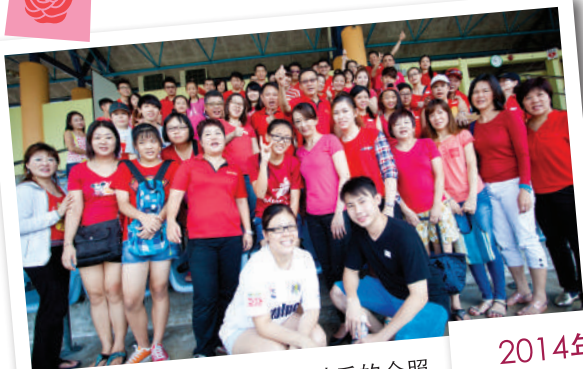
2014 母亲节献花活动后的合照