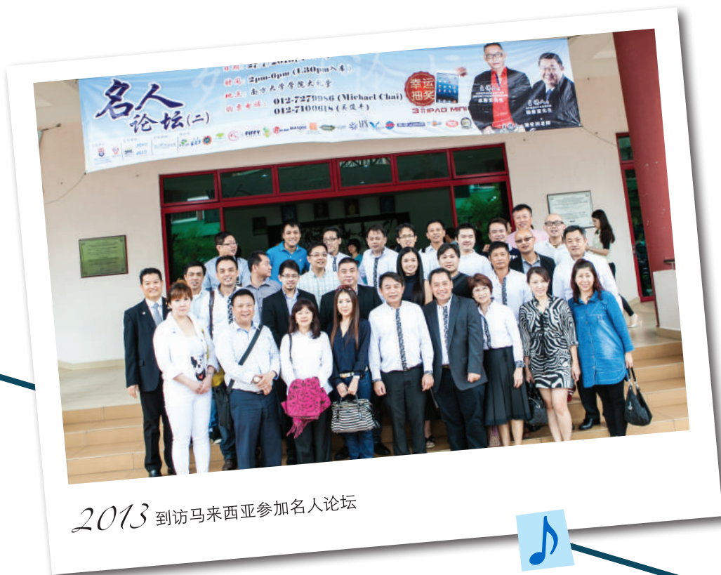
2013 到访马来西亚参加名人论坛