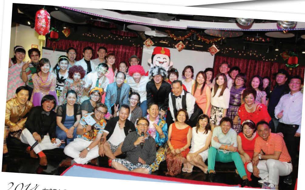
2014 在SEACARE饭店举办欢乐之夜