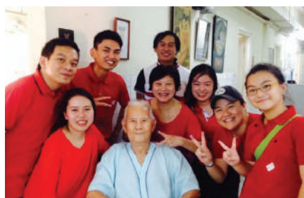
到访老人院母亲节献花活动, 与老人合影