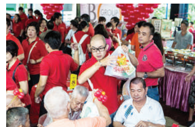
吾老感恩活动上分礼包，让长辈们把甜滋滋的感觉带回家