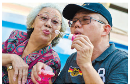
好久没吹泡泡了，好怀念啊！