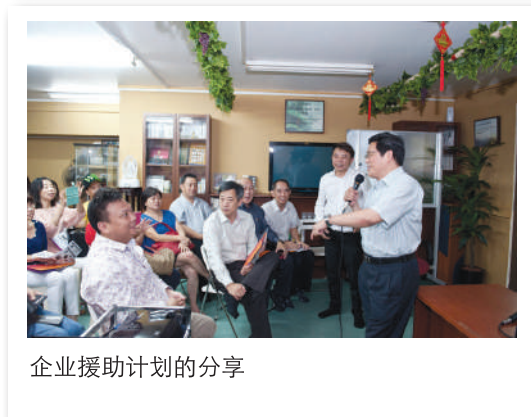
企业援助计划的分享