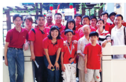
献花给大悲安老院后的合影