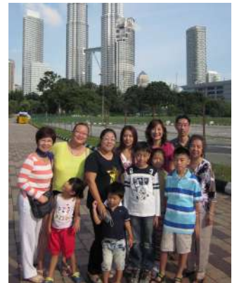
团员以吉隆坡的双峰塔作背景