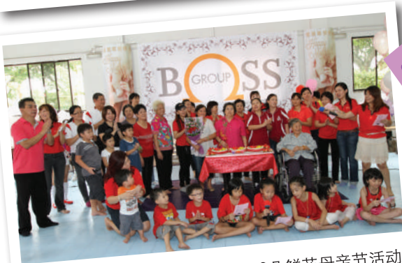
2012 加冷室内举办10,000朵鲜花母亲节活动