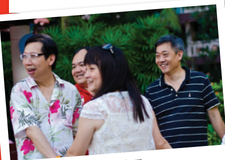
团员合作无间, 默契十足