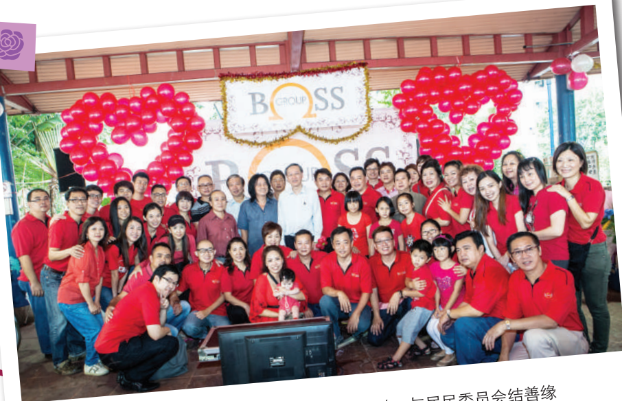
2013 Jalan Bukit Merah 举办吾老感恩活动，与居民委员会结善缘