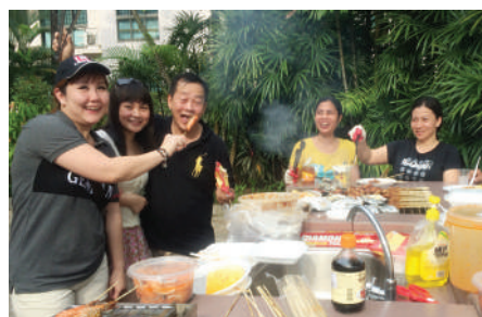
好饿呀！吃个香肠如何？