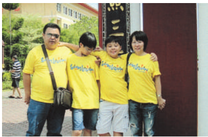
家庭出外游玩乐趣多