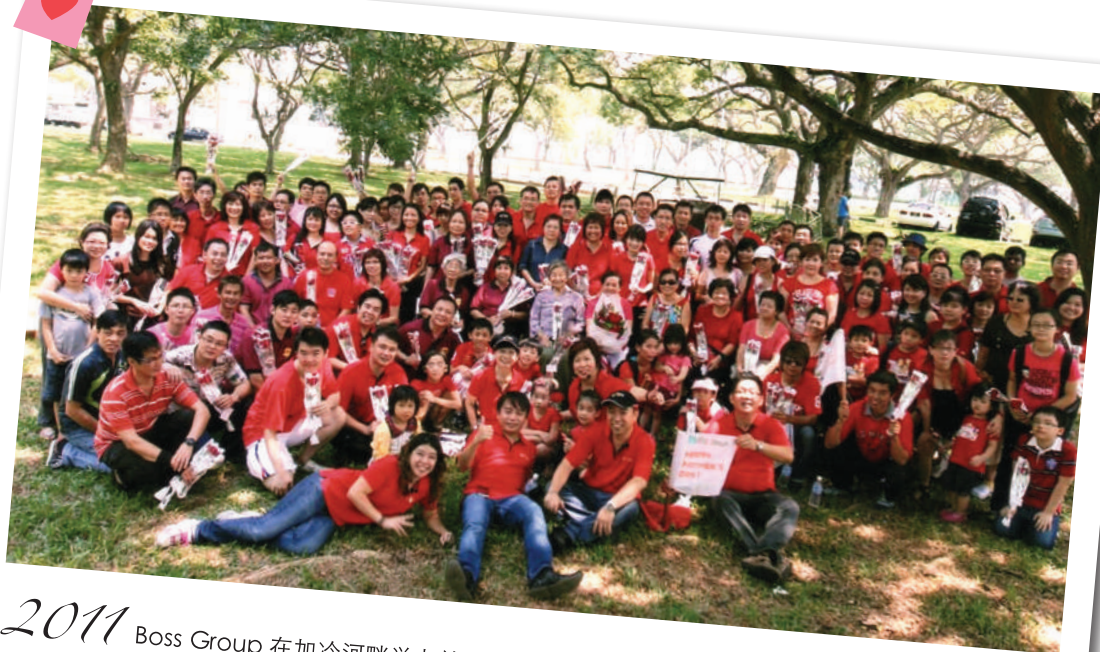
2011 Boss Group 在加冷河畔举办首个3,999朵母亲节感恩活动