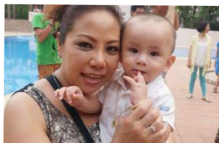
看到什么了？好开心哟！