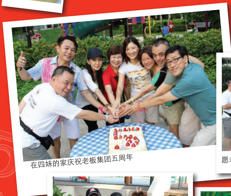
在四妹的家庆祝老板集团五周年