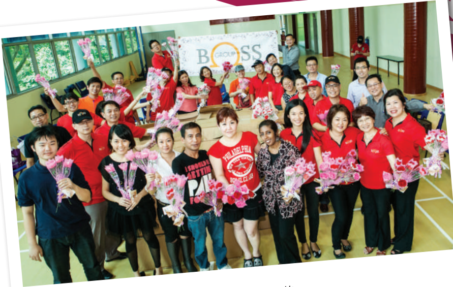
2013 在MINDS慈善机构领取13000朵手工花