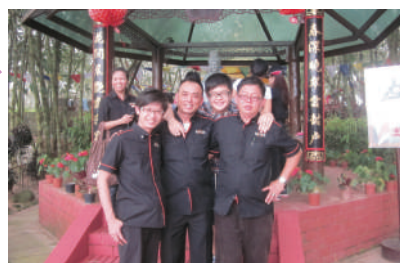
几位帅哥在观音亭前合照