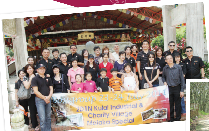
2011 到访座落在马来西亚古来的慈善村