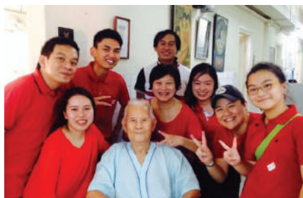
到访老人院母亲节献花活动, 与老人合影