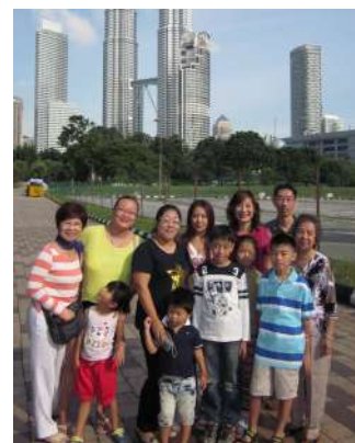
团员以吉隆坡的双峰塔作背景