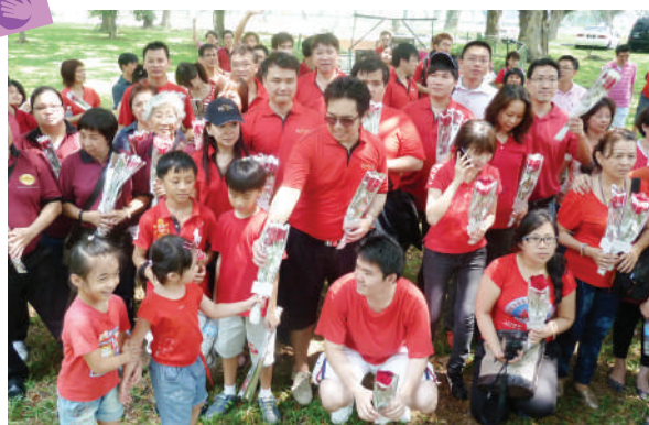
大家手拿鲜花，满腔热情的准备献花