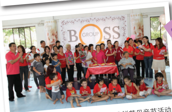
2012 加冷室内举办10,000朵鲜花母亲节活动