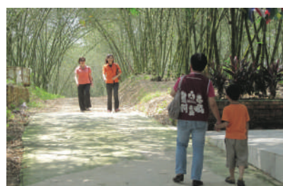
去慈善村时经过一片清幽恬静的竹林