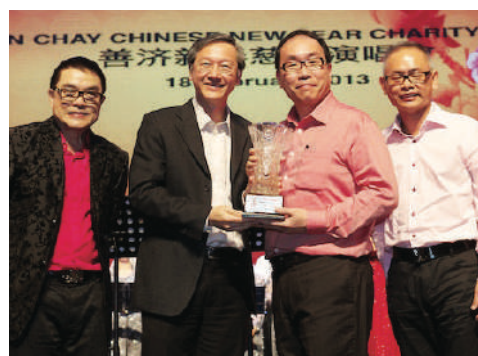
2013 善济新春慈善演唱会 善济董事与陈振泉部长合影

荣幸为“2013 善济新春慈善演唱会”的协办单位，老板集团动员80多位团员及朋友，出钱这慈善活动募款。每个团员都很热心参与和无私的奉献，大家的齐心协力为当晚的节目筹备与组织，也在众多赞助商及善心人士的支持下，也筹得善款。出席的人数有1,600位，演唱会以送票形式邀请热心人士及社区的乐龄人士前来观赏，响应空前的热烈，座无虚席。一切功成圆满。此活动让我们得BG团队更团结。