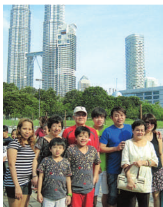
一家大小汇聚一堂