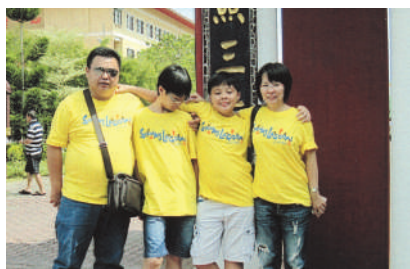
家庭出外游玩乐趣多